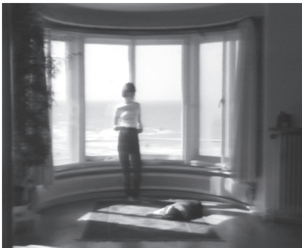
'Passion de l'été pour l'hiver' (video still), Lili Dujourie, 1981, Cera-collectie bij M Leuven © de kunstenaar & Argos Centre for Audiovisual Arts.

Voor M Leuven stelde fotograaf Geert Goiris een collectietentoonstelling samen, geïnspireerd op de donkere kamer (Doka): de magische plek waar analoge foto's ontwikkeld worden en beelden ontstaan. Zorgvuldig gekozen kunstwerken uit de collectie van M worden uit hun sluimerend bestaan in het depot gewekt, belicht en zichtbaar gemaakt. Ons tijdperk is gekenmerkt door snelheid, afleiding, kijken zonder op te merken. Onze perceptie steunt vaak op aannames in plaats van op nauwkeurige waarnemingen. De kunstwerken in DOKA ontwrichten – soms subtiel, dan weer uitgesproken – elke vooringenomenheid. Ze nodigen uit een nieuwe blik te werpen op het bekende en stellen het plezier en de noodzaak van het kijken centraal.